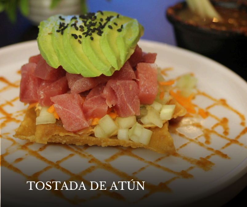
TOSTADA DE ATÚN